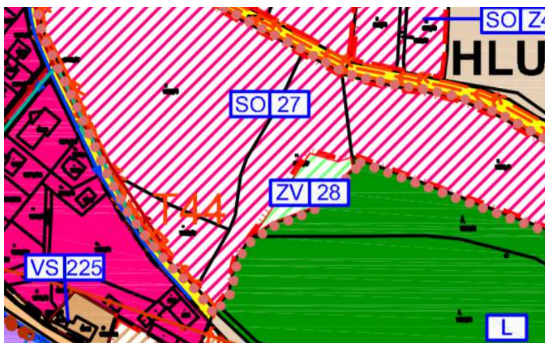
Výřez z ÚP – k.ú. Hluboká nad Vltavou „Zámostí“

SO.27, ZV.28 – lokalita „Zámostí“ – předmětem řešení je změna polohy veřejného prostranství v rámci pozemku p.č. 1002/7 k.ú. Hluboká nad Vltavou (BPEJ 55211 – IV. třída ochrany). Vynětí ploch ze ZPF bylo předmětem původní ÚPD, celkový zábor se nemění.