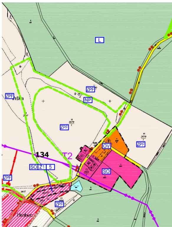
Výřez z ÚP – k.ú. Poněšice

Návrhem dochází k záboru ZPF, nedojde však k narušení celistvosti zemědělsky obhospodařovaných ploch.