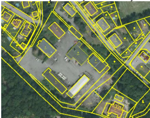
Areál „Lesního závodu“ – snímek z ortofotomapy

Vymezovaná plocha (resp. plocha přestavby) SM je rozdělena do dvou částí SM.Z15.1 a SM.Z15.2. V ploše SM.Z15.2 je přípustná max. podlažnost 2 plná nadzemní podlaží, z důvodu postupného možného navýšování výškové hladiny od zámeckého parku do nitra navrženého lokálního centra.