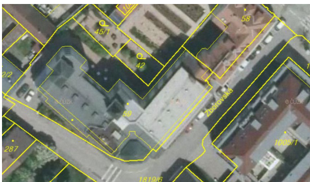
Domov důchodců – Zborovská ul. – snímek z ortofotomapy

V ploše SM.11- p.č. 59 k.ú. Hluboká nad Vltavou , Zborovská ulice – byla posouzena přípustnost navýšení jižního křídla domova důchodců – p.č. 59. Navýšením jižního křídla dochází ke sjednocení výšky obou křídel domu, celková výšková hladina komplexu zůstává zachována. Realizace nástavby domova umožní rozšíření kapacity ubytování seniorů a zlepšení možností evakuace obyvatel (rozšíření výtahu do úrovně 5NP).